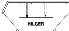
Absetzcontainer 10m 3