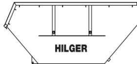
Absetzcontainer 10m 3